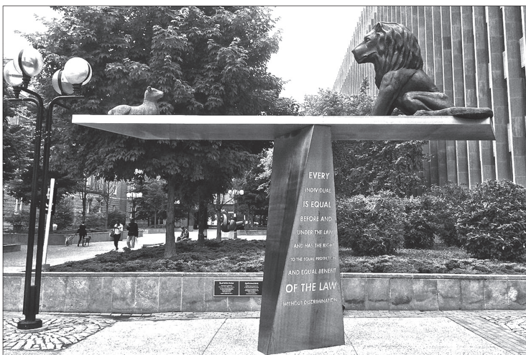
Eldon Garnet: Equal before the Law (2011)